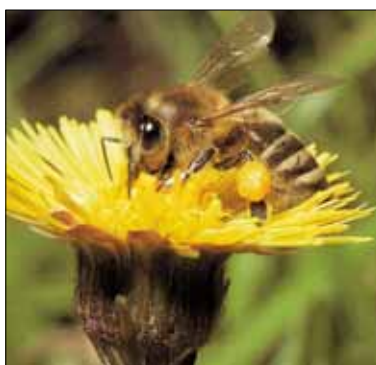
Die Biene beim Sammeln des Nektars

Für die Bestäubung der Obstbäume ist die Honigbiene sehr wichtig. Sie lebt in Völkern bis zu 50.000 Bienen. Mit der Honigbiene und dem Honig beschäftigt sich der Imker.